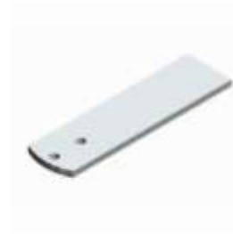
STL Zadní držák, délka = 220mm (2 ks/balení)