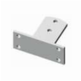
STP Zadní držák k našroubování (2 ks/balení)