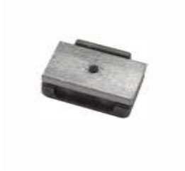
BK 02 TOP Mechanický koncový spínač pro Jet Top (2 ks/balení)