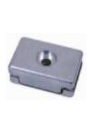
BK 01 Mechanický koncový spínač (2 ks/balení)