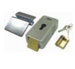
LOCK VE Vertikální elektrozámek 12V