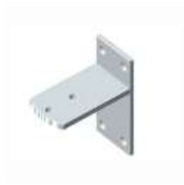
STP 02 Zadní držák k našroubování -svíslý (2 ks/balení)