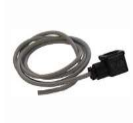
CJ 24 Konektor s kabelem pro Jet 24. (délka = 1,2m)