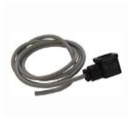
CJ 230 Konektor s kabelem pro Jet 230. (délka = 1,2m)