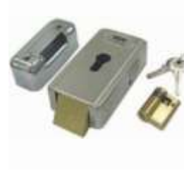
LOCK HO Horizontální elektrozámek 12V