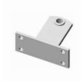
STA Přední držák k našroubování (2 ks/balení)