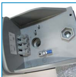
Svorkovnice pro napájení pohonů