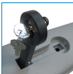
Odblokování pohonu pomocí klíčku