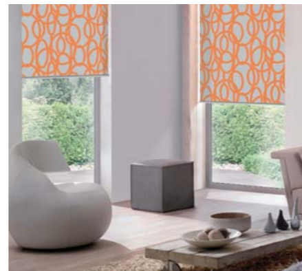
VNITŘNÍ LÁTKOVÉ STÍNĚNÍ