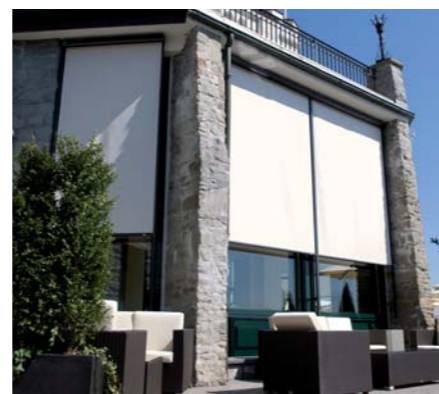
SVISLÉ FASÁDNÍ CLONY