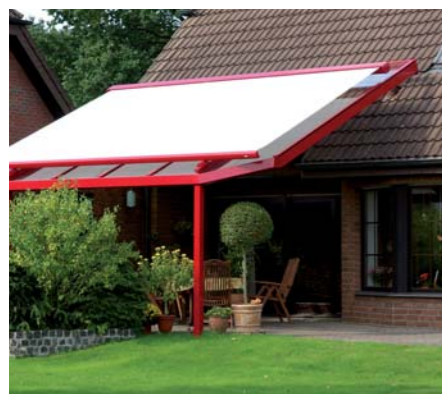
PERGOLY A ZIMNÍ ZAHRADY