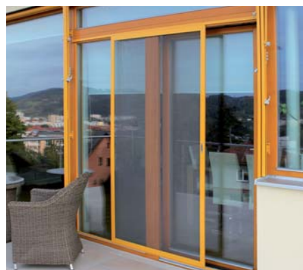
SÍŤ PROTI HMYZU