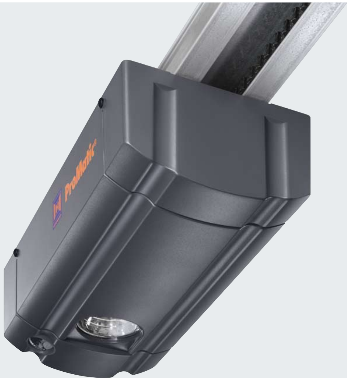
ProMatic Standardně s ručním vysílačem HSE 2 BS v černé barvě

Pohony garážových vrat ProMatic jsou vybaveny osvědčenou technikou Hörmann – stejně jako všechny ostatní prémiové pohony Hörmann. To zajišťuje jejich spolehlivou funkci za atraktivní cenu. Ani u garáží bez napojení na elektřinu se nemusíte vzdát pohodlí pohonu. Pohon ProMatic Akku to umožňuje. Lze jej snadno přepravovat a rychle nabít za několik hodin.