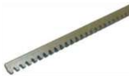
CRIS 400 Hřeben ocelový pozink. 22x22x1000