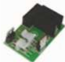
BAT K2 Nabíječka pro Bat M016