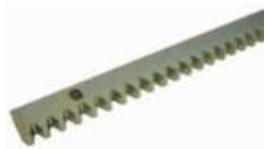
CRIS 200 Hřeben ocelový pozink se šrouby a distančními podložkami. 30x12x1000