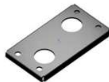
PDY 100 Základová deska pro montáž na zem