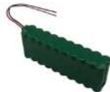
BAT M 016 Baterie 24V 1,6 Ah pro Star D 124